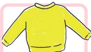
トレーナー Sweat shirt