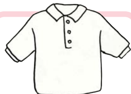
ポロシャツ Polo shirt