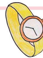
腕時計うでどけい Wristwatch